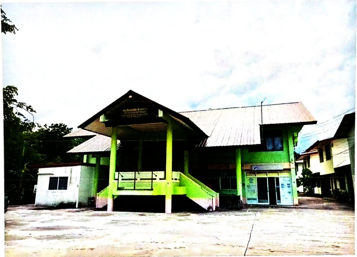
กำหนดสถานที่เป็นเขตปลอดบุหรี่